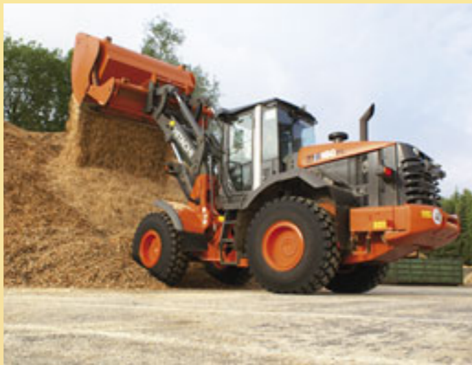
Pyöräkuormaajuuksista mukana on mm. Rotator Oy:n maahantuoma suoraisainen Hitachi ZW180PL.

Suomessa asennettuna CAT 324DL kaivukoneeseen. Smart Boom -puomin kelluntatoimintoa pääsee testaamaan varta vasten tehdyllä koeajoradalla. Myös kaivinkonesimulaattorilla pääsevät kaikki halukkaat testaamaan ajotaitojaan.