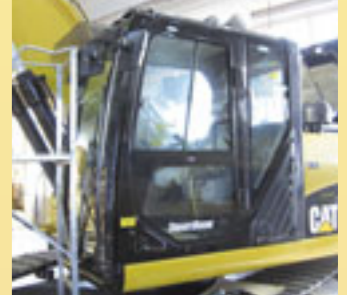
Smart Boom -puomin kelluntatoimintoa pääsee testaamaan Witraktorilla varta vasten tehdyllä koeajoradalla. Myös kaivinkonesimulaattorilla pääsevät kaikki halukkaat testaamaan ajotaitojaan.