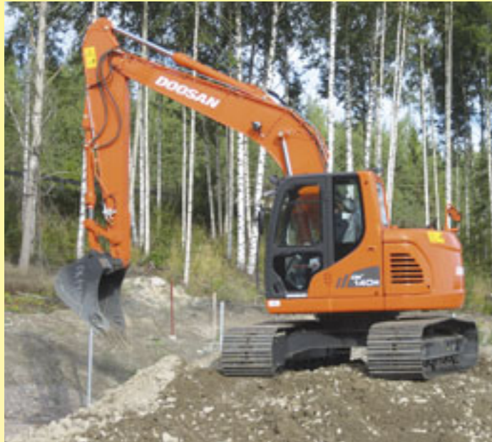
Kaivukoneita eri kokoluokissa Mörinöllä riittää. Dae-Tek Oy esittelee mm. uusimpana Doosan-mallina 14 tonnin kokoluokkaan lyhytperäisen DX140R kaivukoneen.