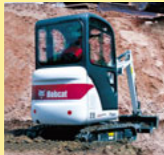
Minikaivukoneuuksia ovat mm. Bobcat E16, E35.

Rotator Oy:n maahantuomina uutuuksina esillä ovat Hitachi ZW180PL suoraisainen pyöräkuormaaja ja ZX360W-3 pyöräalustainen materiaalinkäsittelykone. Luonnollisesti myös muita Hitachi kaivukoneita on laajasti mukana. Merlo kurottajista esitellään mm. Merlon uutuusmallit P25.6 ja Roto 40.25 MCSS. Trukkiosasto esittelee Nissanin trukkiuutuuden GX:n ja