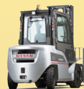
Myös trukkeja ja muita nostokoneita on mukana, kuten uusi Nissanin GX-mallisarja.