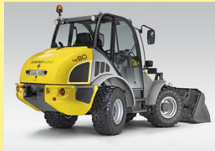
Täysin uusi Kramer 480 Arctic Power -varustuksella esitellään KH-Koneet Oy:n toimipisteessä Sarankulmassa.

Koneliikkeiden sijainnit kannattaa tarkistaa etukäteen tapahtuman