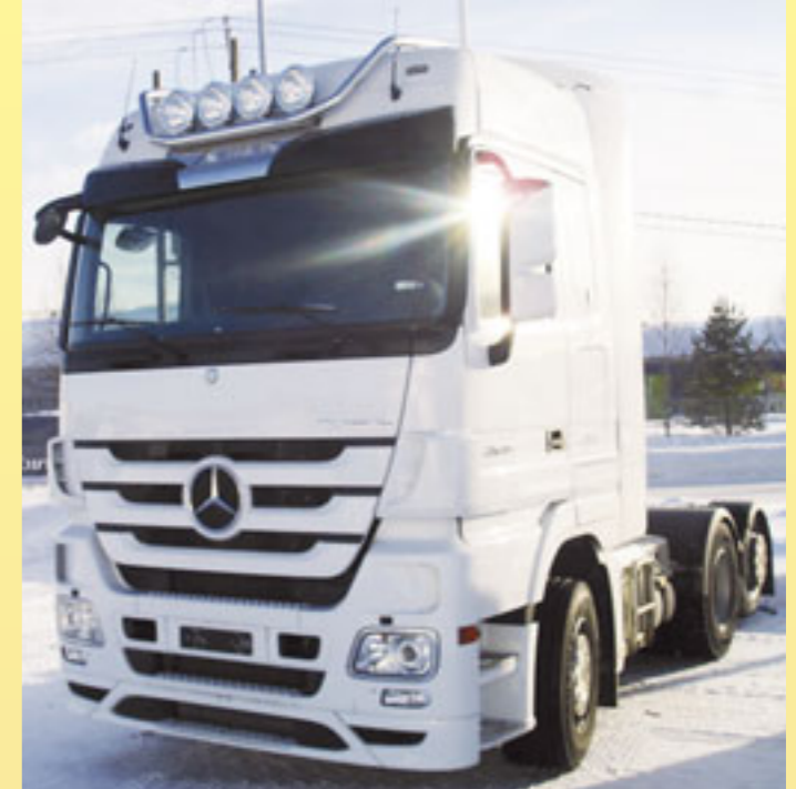
Mercedes-Benz Actros 2548 LS 6x2/305 takateliiveturin on vain yksi esimerkki Manssen Möriinöiden laajasta hyötyajoneuvovalikoimasta.