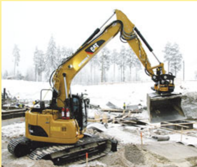
Suomen ensimmäinen lyhytperäinen CAT 314D LCR on esillä Witraktorin toimipisteessä kaikilla herkuilla.

Wihuri Oy Witraktor tuo nähtävälle uutustuotteena mm. CAT D6T XL puskukoneen, jonka uusi telastokulkee nimellä System One. Valmistaja lupaa sille jopa 35 % lisää käyttöikää normaaliin verrattuna. Suomen ensimmäinen lyhytperäinen CAT 314D LCR on myös esillä kaikilla herkuilla. Uusimpien vaatimusten mukainen CAT ROPS -ohjainmo (Roll Over Protection System) nähdään myös ensimmäistä kertaa